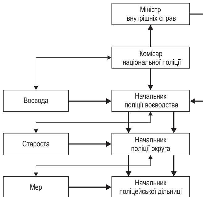
Схема І.4.1. Організаційна структура поліції Польщі