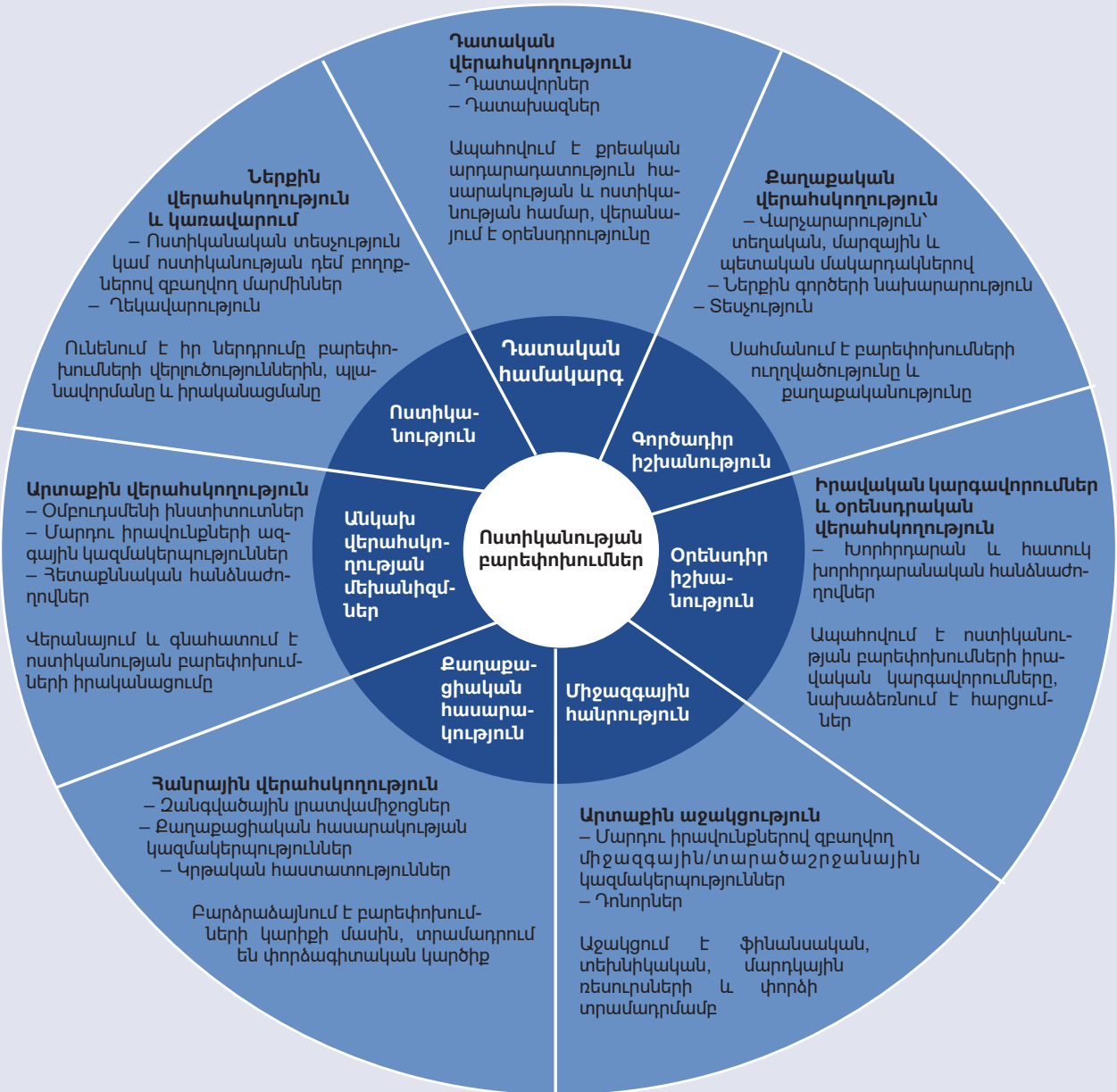
Գծապատկեր 1 Ոստիկանության բարեփոխումներն ընդգրկում են մի շարք պետական և ոչ պետական դերակատարների