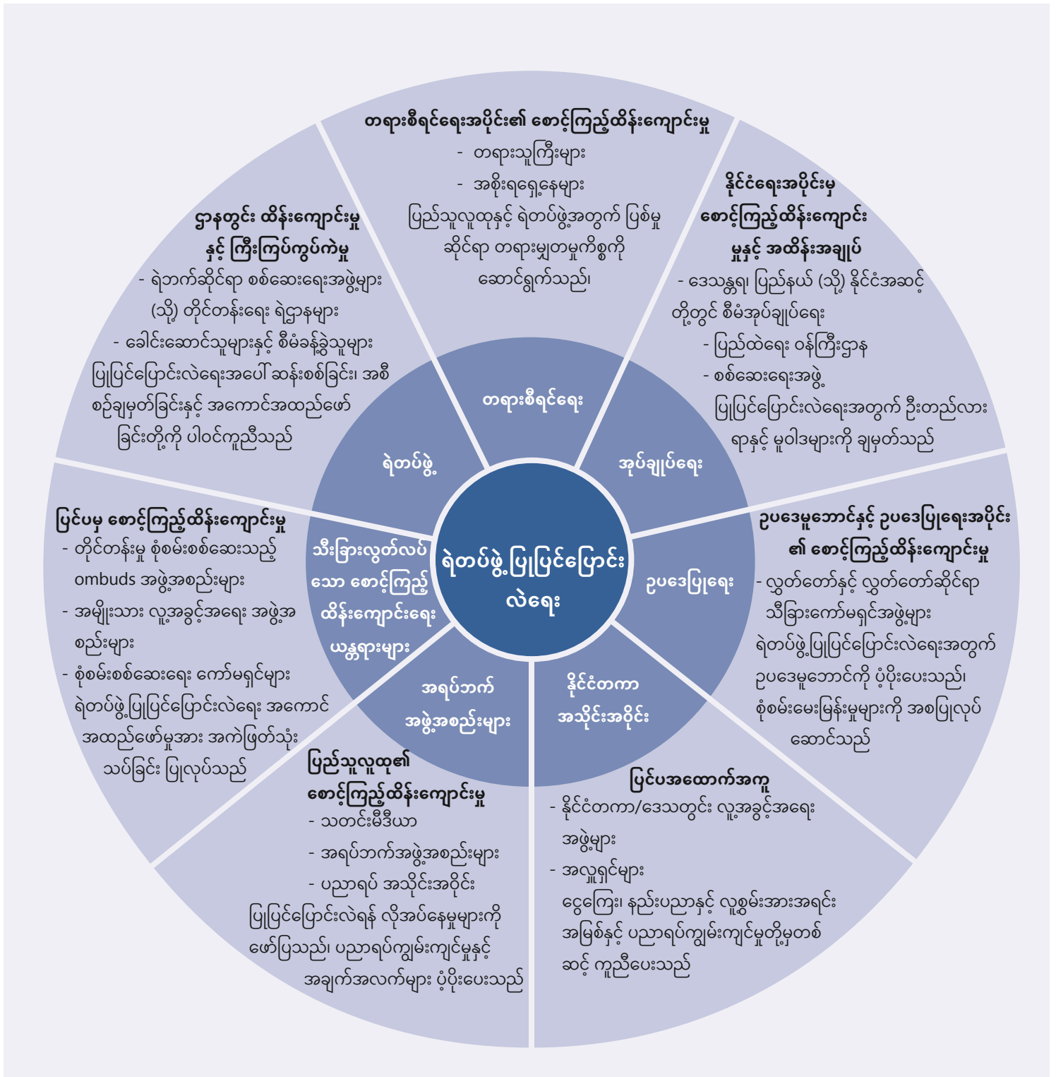
ပုံ ၁ ရဲတပ်ဖွဲ့ပြုပြင်ပြောင်းလဲရေးလုပ်ငန်းတွင် နိုင်ငံအစိုးရပိုင်နှင့် နိုင်ငံအစိုးရပိုင်မဟုတ်သော အဖွဲ့အစည်း အမျိုးမျိုး ပါဝင်ပါသည်။