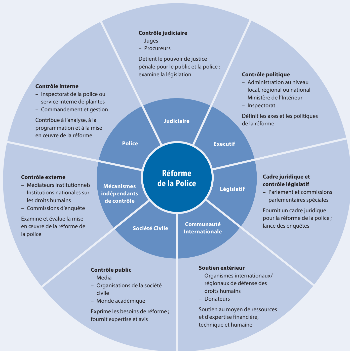
Figure 1 La réforme de la police implique une variété d'acteurs étatiques et non-étatiques