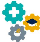
Agences de développement